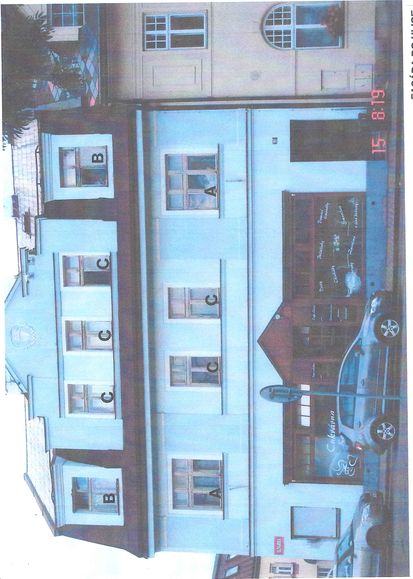
FASÁDA DO ULICE