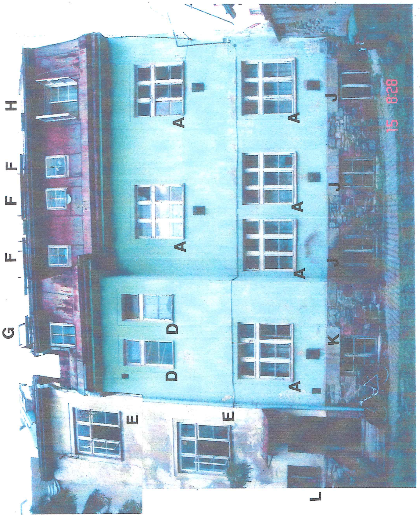
FASÁDA DO DVORA